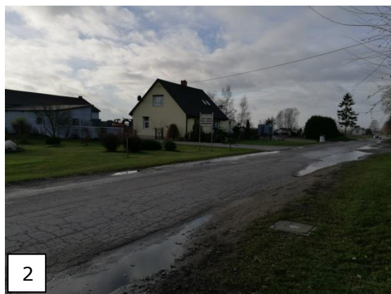
Fot.1 i 2 Istniejące zabudowania gospodarstwa rolnego przy drodze powiatowej DP 2337C. Zieleń wokół istniejącej zabudowy.