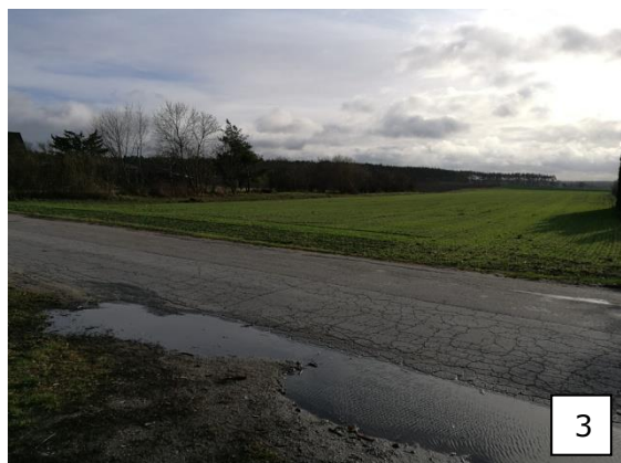
Fot.3 Teren użytkowany rolniczo przeznaczony w projekcie planu pod zabudowę mieszkaniowo-usługową