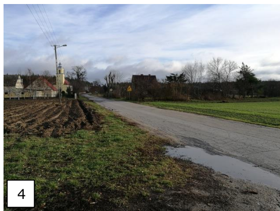
Fot.4 Zabudowania wsi Kierzkowo. Tereny użytkowane rolniczo.