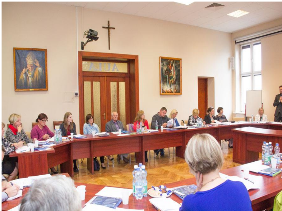
Warsztaty z organizacjami pozarządowymi

9 listopada 2015 roku Burmistrz Żnina wydał Zarządzenie nr 214/2015 w sprawie przeprowadzenia konsultacji projektu uchwały "Rocznego Programu Współpracy Gminy Żnina na rok 2016 z organizacjami pozarządowymi oraz podmiotami, o których mowa w art. 3 ust. 3 ustawy o działalności pożytku publicznego i o wolontariacie". Projekt ww. dokumentu został opublikowany na stronie internetowej Urzędu Miejskiego w Żninie, w Biuletynie Informacji Publicznej oraz na tablicy ogłoszeń urzędu. Konsultacje były przeprowadzone w terminie od 9 listopada 2015 r. do 23 listopada 2015 r. Żadna z organizacji nie zgłosiła uwag co do konsultowanego dokumentu.