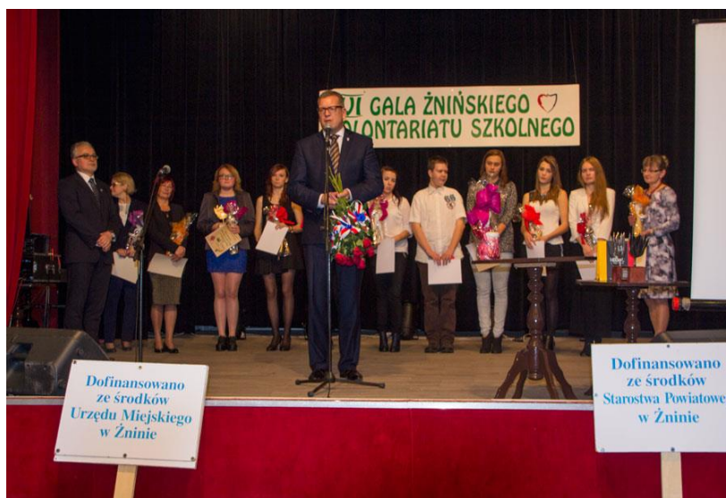
Gala Żnińskiego Wolontariatu