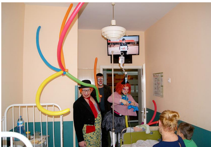
Świąteczna Niespodzianka – Kościół Ewangelicznych Chrześcijan