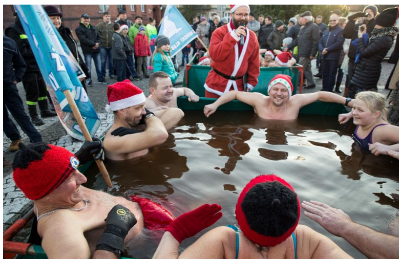
Pokazy Żnińskiego Klubu Morsa