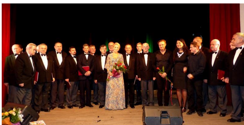
Chór Moniuszko w Żninie