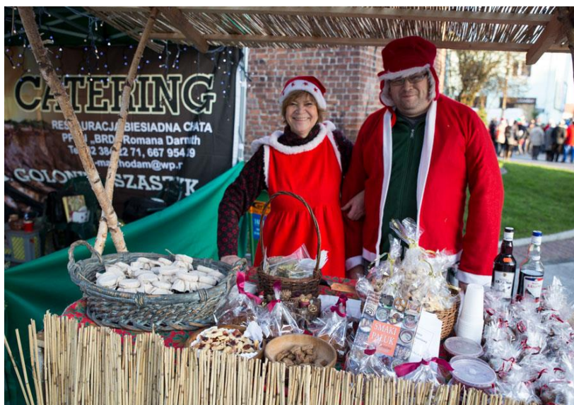
Kuchnia Pałucka i jej stoisko na Jarmarku św. Mikołaja