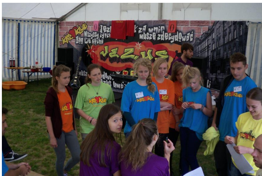
Kidz Klub – Kościół Ewangelicznych Chrześcijan w Żninie

Organizacje pozarządowe promowały także Gminę Żnin w kraju oraz poza jego granicami (np. Klub Sportowy „Jeziorak”, Żnińskie Towarzystwo Turystyki Kajakowej, Pałucki Oddział Polskiego Towarzystwa Turystyczno-Krajoznawczego, Pałuckie Towarzystwo Motocyklowe „Czaple”).