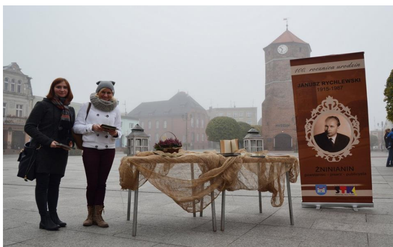
„Cykl przedsięwzięć w ramach 100. Rocznicy urodzin Janusza Rychlewskiego”- Stowarzyszenie Trochę Kultury!

III. 2 lutego 2015 r. Burmistrz Żnina wydał Zarządzenie nr 14/2015 w sprawie ogłoszenia otwartego konkursu ofert na udzielenie dotacji stanowiących wkład własny organizacji pozarządowych do projektów współfinansowanych ze środków zewnętrznych, przeznaczonych na realizację zadań własnych Gminy Żnin w roku 2015. Na ww. konkurs przeznaczono 10.000,00 zł. Nabór ofert zakończono 30 listopada 2015 r. Na konkurs nie wpłynęła żadna oferta.