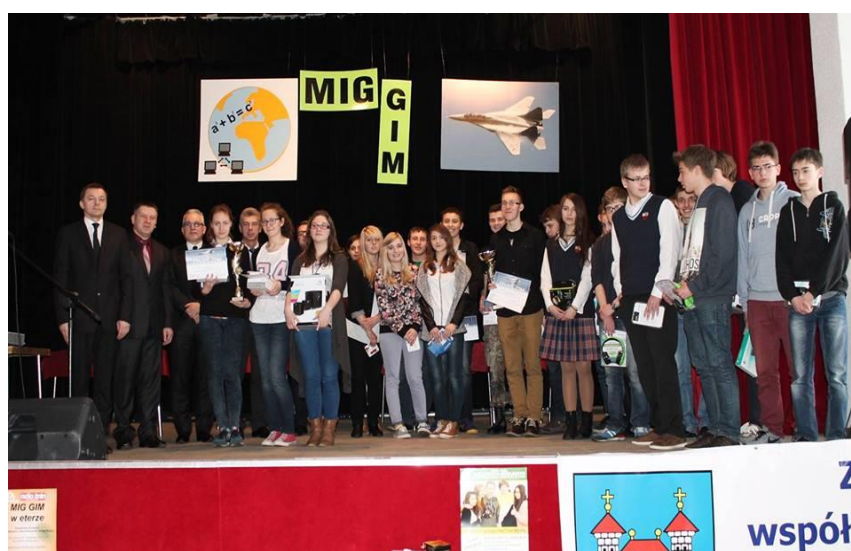
Konkurs Mig-GiM – Stowarzyszenie Edukacyjne „Ekonomik”