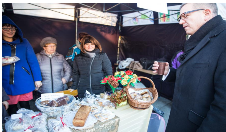
Koła Gospodyń Wiejskich na Jarmarku św. Mikołaja

Organizacje pozarządowe aktywnie uczestniczyły w większości przedsięwzięć promocyjnych Gminy Żnin. Dzięki ich wsparciu oraz działaniom można było wzbogacić ofertę oraz podwyższyć jakość wielu wydarzeń. Szczególnie zaangażowane były następujące organizacje i podmioty: Szczęp Żnińskich Drużyn Harcerskich, Koła Gospodyń Wiejskich, Stowarzyszenie Chór Męski im. St. Moniuszki w Żninie, Fundacja TV Żnin, Ochotnicze Straże Pożarne, Pałuckie Wodne Ochotnicze Pogotowie Ratunkowe, Stowarzyszenie Sympatyków Harcerstwa Żnińskiego, Stowarzyszenie Kapitał Zaufania, Stowarzyszenie Browarowa - Większy Format, Stowarzyszenie Motocyklowe „Czaple”, Parafia pw. św. Floriana w Żninie, Parafia pw. Najświętszej Marii Panny Królowej Polski w Żninie, Żniński Klub Morsa, Lokalna Grupa Działania Pałuki-Wspólna Sprawa, Stowarzyszenie Kuchnia Pałucka.